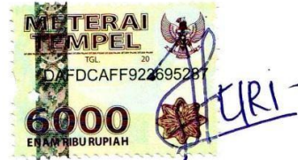
Furi Ika Setyowati