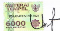
Uyum Dewi Safitri